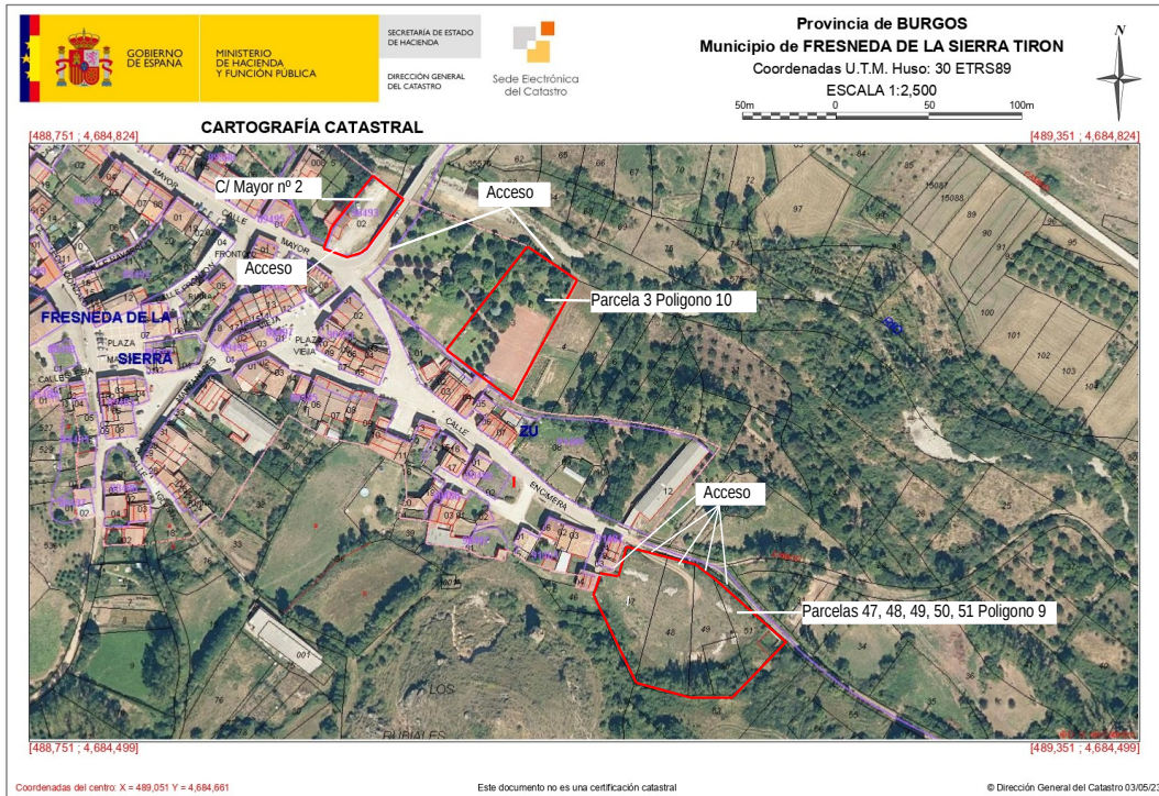
Ortofoto indicando las parcelas afectadas por la Modificación Puntual.